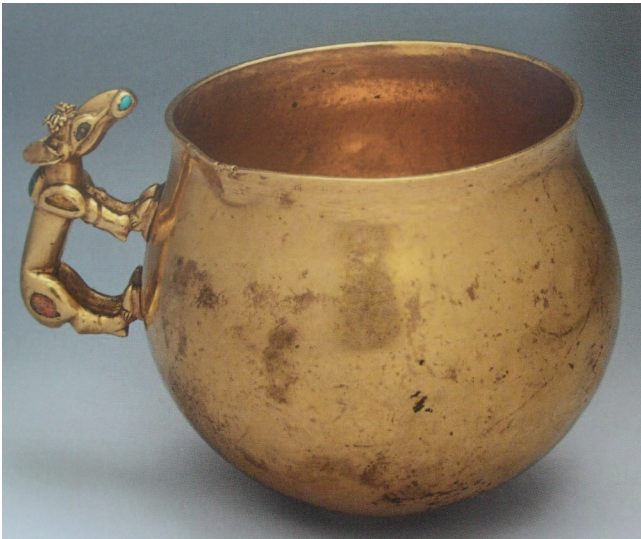
Vaso con asa zoomórfica. Siglo I. d.C.

imperiales, pero por otro la ambición de abarcar el arte que iba siendo canonizado en Occidente. No en vano, Catalina la Grande desarrolló su reinado en la época de la Ilustración. Es más, ella misma fue aconsejada por quien se considera uno de los fundadores del concepto de crítica, el francés Denis Diderot quien en 1773 fue invitado a la corte de San Petersburgo. De esa forma, el arte del siglo XVIII es uno de los mejor representados en el Hermitage, siendo conveniente poner de manifiesto que obras que se compraron habían sido elaboradas por artistas coetáneos; una operación siempre llena de riesgos pero que, en este caso, favoreció una extensa colección de pinturas, esculturas y dibujos del siglo XVIII, incluyendo a autores neoclásicos como Anton Raphael Mengs o a los escultores Antonio Canova y Jean-Antoine Houdon. De éste último, es obra un busto del intelectual francés Françoise-Marie Arouet, Voltaire, de quien la emperatriz llegó a proclamarse discípula.