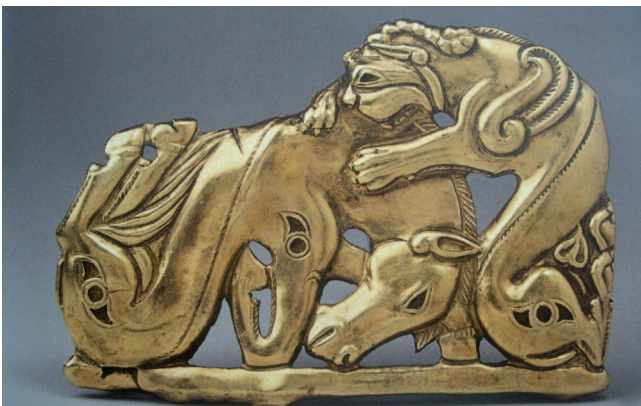
Brazalete en espiral con figuras zoomórficas. Siglos IV.-III a.C.

imperiales, pero por otro la ambición de abarcar el arte que iba siendo canonizado en Occidente. No en vano, Catalina la Grande desarrolló su reinado en la época de la Ilustración. Es más, ella misma fue aconsejada por quien se considera uno de los fundadores del concepto de crítica, el francés Denis Diderot quien en 1773 fue invitado a la corte de San Petersburgo. De esa forma, el arte del siglo XVIII es uno de los mejor representados en el Hermitage, siendo conveniente poner de manifiesto que obras que se compraron habían sido elaboradas por artistas coetáneos; una operación siempre llena de riesgos pero que, en este caso, favoreció una extensa colección de pinturas, esculturas y dibujos del siglo XVIII, incluyendo a autores neoclásicos como Anton Raphael Mengs o a los escultores Antonio Canova y Jean-Antoine Houdon. De éste último, es obra un busto del intelectual francés Françoise-Marie Arouet, Voltaire, de quien la emperatriz llegó a proclamarse discípula.