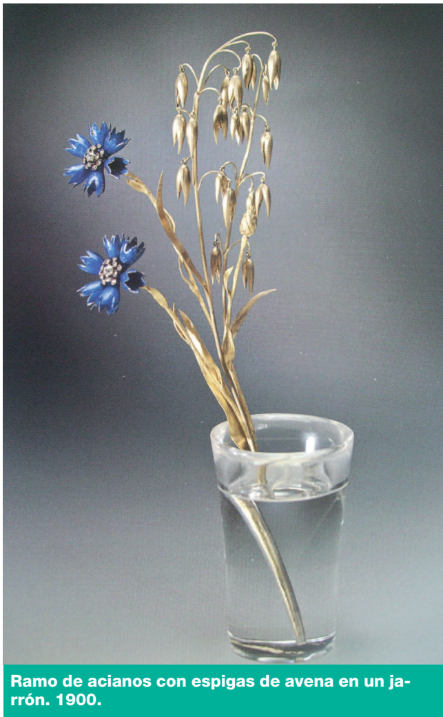
Ramo de acianos con espigas de avena en un jarrón. 1900.

Un aspecto de la cultura es el conjunto de formas materiales que los hombres producen para poner a su servicio la naturaleza. De ello es buen ejemplo la ciudad de San Petersburgo, no sólo arrebatada bélicamente al enemigo sino, en otra singular lucha, construida en una zona pantanosa que, con el ejemplo de los Países Bajos, debía ser dominada. Pero la cultura está constituida también por las formas simbólicas con las que un grupo humano hace pública y visible su identidad transmitiéndola a lo largo del tiempo. Pues bien, la ciudad de San Petersburgo tomó como referencias las ciudades de París y Amsterdam. Pedro I contrató ingenieros arquitectos e ingenieros occidentales para hacer patente que Rusia quería colocarse a su mismo nivel; una ciudad occidentalizada, aseada, ordenada, en la que era grato vivir, pues occidentalización y modernización son los dos vectores simbólicos con los que Pedro I, y sus sucesores Catalina, -que gobernó entre 1762 y 1796-, y Nicolás I -que lo hizo entre 1825 y 1855- quisieron dotar a la ciudad. Algo que en la exposición del Museo del Prado queda patente en las dos primeras salas de la exposición a la que nos